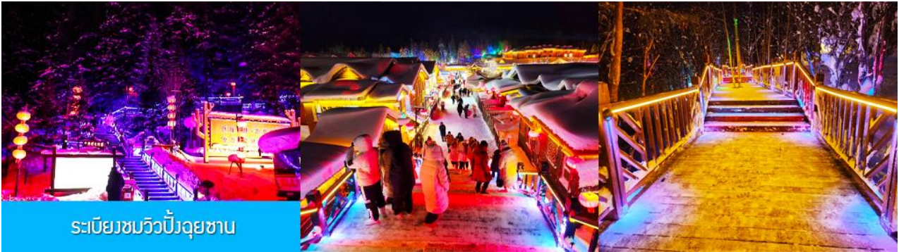
ระเบียงชมวิวยิ่งจฺยชาน

นำท่านสู่ระเบียงชมวิวยิ่งจฺยชาน 棒槌山观光栈道 เป็นระเบียงทางเดินชมวิวยิงจฺยชานบนเนินที่ทำด้วยไม้ มีความยาว 3,200 เมตร ระเบียงทางเดินชมวิวยิ่งจฺยชานนี้ได้พาดผ่านจุดชมวิวยิงจฺยชานต่าง ๆ ที่สามารถมองเห็นทัศนียภาพที่สวยงามของเมืองในเทพนิยายในมิติและมุมมองที่หลากหลาย เป็นที่นิยมของนักท่องเที่ยวที่ชื่นชอบการถ่ายภาพเป็นอย่างยิ่ง เพราะระเบียงทางเดินชมวิวยิ่งจฺยชานมีมุมสวย ๆ ให้ถ่ายรูปตลอดเส้นทาง, เดินบนระเบียงไม้มีค่าใช้จ่ายใด ๆ ท่านสามารถเดินชมวิวยิ่งจฺยชานได้ตามอัธยาศัย จนอิ่มใจ