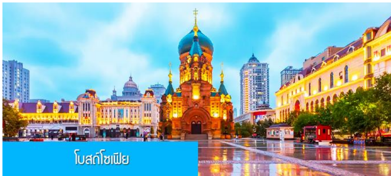
โบสถ์โซเฟีย