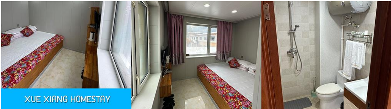
XUE XIANG HOMESTAY

ขยับแขนขาตามจังหวะดนตรี และเป็นเป็นจุดเช็คอินยอดนิยมสำหรับนักท่องเที่ยวที่มาเยือน นอกจากนี้ที่นี่ยังมีร้านขายของที่ระลึก และร้านอาหาร แผงขายผลไม้แช่แข็ง และสินค้าพื้นเมืองต่าง ๆ มากมาย..