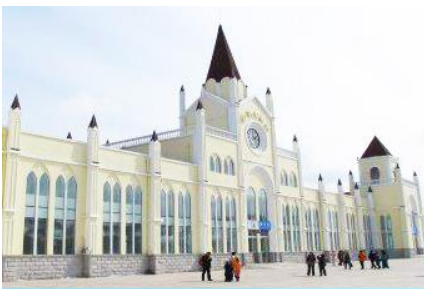
สถานีรถไฟยาบูลิ

หมายเหตุ เพื่อความสะดวกในการเข้าพักใน HOME STAY ภายในหมู่บ้านหิมะ ทางทัวร์แนะนำให้ท่านจัดเตรียมเสื้อผ้าและเครื่องใช้เท่าที่จำเป็น 1 ชุดใส่กระเป๋าใบเล็กหรือเป้แบบสะพายได้ เพื่อสะดวกในการนำติดตัวไปใช้สำหรับคืนที่นอนในหมู่บ้านหิมะ หากนำกระเป๋าเดินทางใบใหญ่เข้าสู่ที่พักในหมู่บ้านอาจสร้างความไม่สะดวกแก่ท่าน จึงไม่แนะนำ