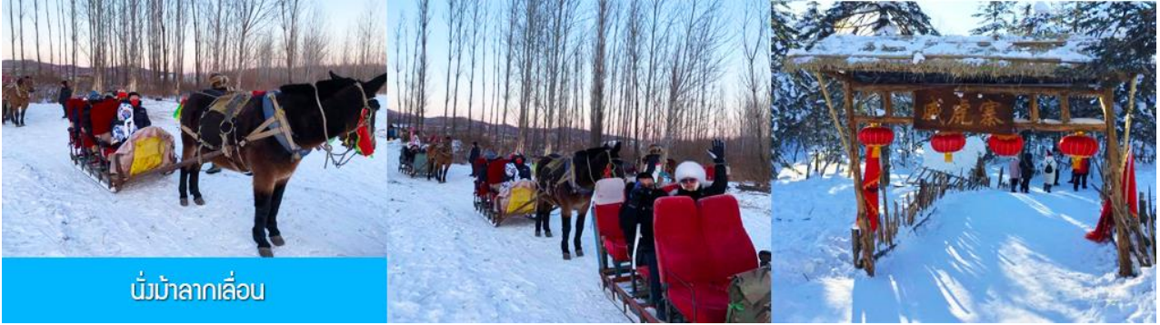
นั่งม้าลากเลื่อน