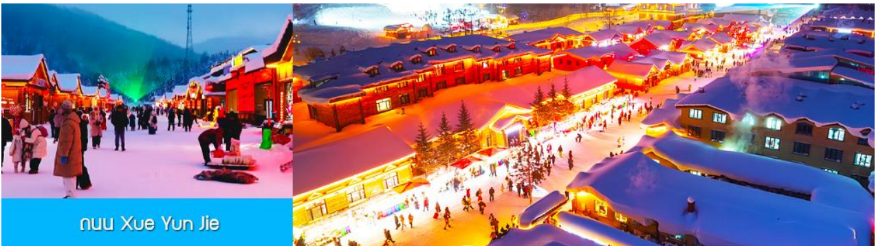
ถนน Xue Yun Jie

นำท่านสู่ระเบียงชมวิวยิ่งจฺยชาน 棒槌山观光栈道 เป็นระเบียงทางเดินชมวิวยิงจฺยชานบนเนินที่ทำด้วยไม้ มีความยาว 3,200 เมตร ระเบียงทางเดินชมวิวยิ่งจฺยชานนี้ได้พาดผ่านจุดชมวิวยิงจฺยชานต่าง ๆ ที่สามารถมองเห็นทัศนียภาพที่สวยงามของเมืองในเทพนิยายในมิติและมุมมองที่หลากหลาย เป็นที่นิยมของนักท่องเที่ยวที่ชื่นชอบการถ่ายภาพเป็นอย่างยิ่ง เพราะระเบียงทางเดินชมวิวยิ่งจฺยชานมีมุมสวย ๆ ให้ถ่ายรูปตลอดเส้นทาง, เดินบนระเบียงไม้มีค่าใช้จ่ายใด ๆ ท่านสามารถเดินชมวิวยิ่งจฺยชานได้ตามอัธยาศัย จนอิ่มใจ