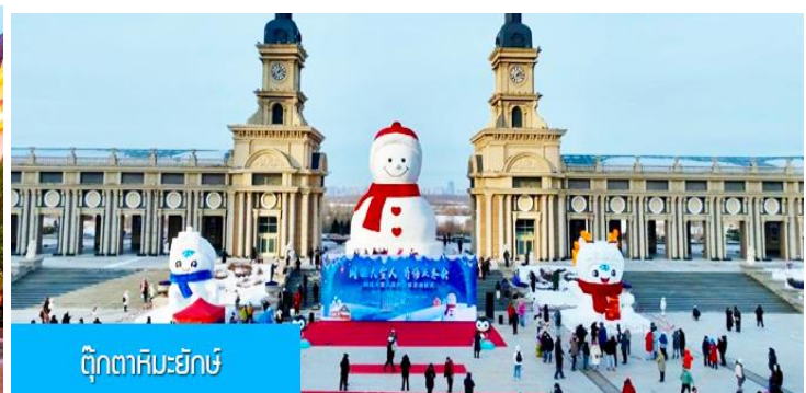
ตุ๊กตาคิมะฮักซ์