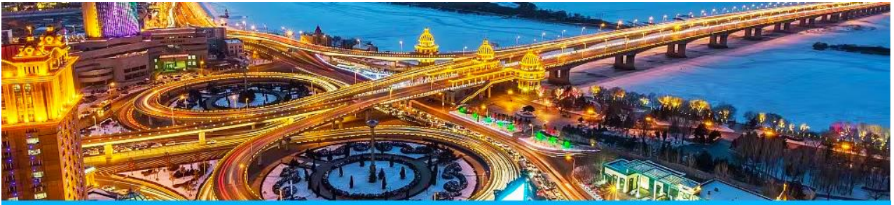
นครฮาร์บิน