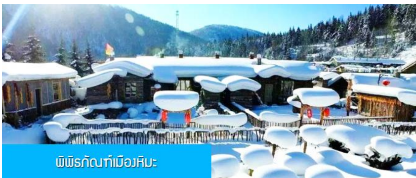
พิพิธภัณฑ์เมืองหิมะ

การไปพักในหมู่บ้านหิมะทางทัวร์ไม่สามารถจัดรถทัวร์ไปส่งรถทัวร์ถึงหน้าโฮมสเตย์ได้ ไปได้จะนำคณะขึ้นรถ Shuttle Bus ของอุทยานเข้าไปยังหมู่บ้านหิมะ โดยรถทัวร์ต้องถือหรือลากกระเป๋าเข้าที่พักด้วยตัวเอง เพราะโฮมสเตย์จะไม่มีพนักงานยกกระเป๋ามาคอยบริการยกกระเป๋าให้ผู้เข้าพัก ท่านควรจัดเตรียมกระเป๋าใบเล็กที่บรรจุเสื้อผ้าและเครื่องใช้จำเป็นสำหรับการพักผ่อน ณ โฮมสเตย์ในเมืองหิมะในคืนนี้ เพื่อสะดวกต่อการเคลื่อนย้ายกระเป๋าภายในโฮมสเตย์จะมีสบู่อบอุ่น แชมพูภายในห้องน้ำ แปรงสีฟันยาสีฟัน แต่จะไม่มีหมวกคลุมผมสำหรับสุภาพสตรีควรเตรียมไปด้วย