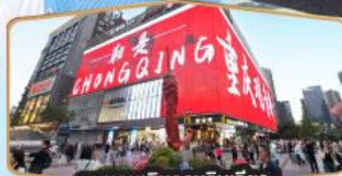
ถนนคนเดินทงหยวนเฉียว