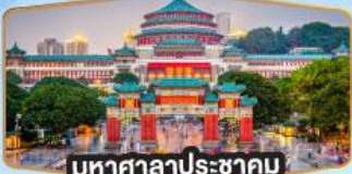
มหาศาลาประชาชน