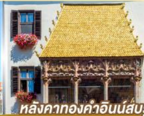
หลังคาทองคำอินน์ส์บรุค