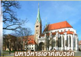
มหาวิหารเอาก์สเวิร์ค