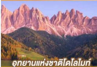
อุทยานแห่งชาติโดโลไมท์

ปีนตรอกนครอัมสเตอร์ดัม กับเส้นทางสายโรแมนติก พร้อมการแสดงพื้นบ้านสไตล์ที่โรเลียนสุดพิเศษ