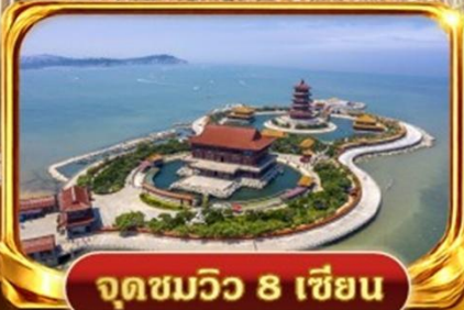
จุดชมวิว 8 เซียน