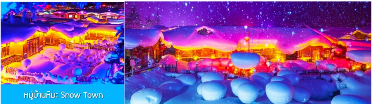
หมู่บ้านหิมะ Snow Town

ท่ามกลางท้องทุ่งและผืนป่าที่ปกคลุมด้วยหิมะราวกับอยู่ในโลกแห่งเทพนิยาย ผ่านหมู่บ้าน เวยหูจ้าย 威虎寨 ที่อดีตเคยเป็นที่ตั้งของรังโจรที่มักออกปล้นสะดมชาวบ้าน ม้าลากเลื่อนเป็นยานพาหนะเฉพาะพื้นที่ ๆ ที่นิยมนำมาใช้ในการเดินทางหรือลำเลียงสิ่งของในช่วงฤดูหนาว ที่ใช้ม้ามาลากจูงแคร่เลื่อนให้สามารถเคลื่อนย้ายบนลานหิมะได้