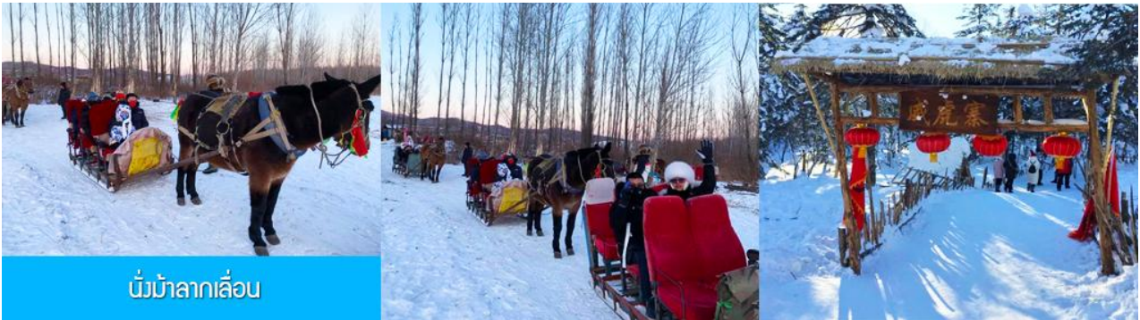
นั่งม้าลากเลื่อน

เที่ยง รับประทานอาหารกลางวัน ณ ภัตตาคาร (5)