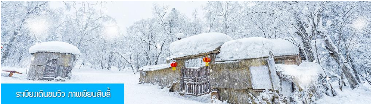
ระเบียบดินชมวิวก ภาพเขียนสิบลี้