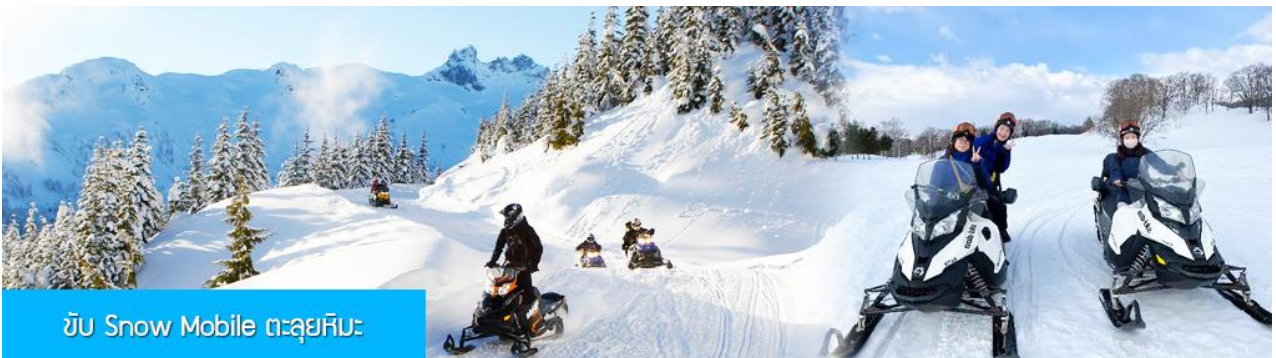
ขับ Snow Mobile ตะลุยหิมะ

เที่ยง รับประทานอาหารกลางวัน ณ ภัตตาคาร (8)