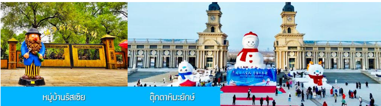
หมู่บ้านรัสเซีย

นำท่าน นั่งกระเช้าชมความสวยงามของแม่น้ำซวงเวาเจียงในฤดูหนาว 乘缆车跨越松花江 แม่น้ำสายหลักที่ไหลผ่านเมืองฮาร์บิน ในช่วงฤดูหนาวน้ำในแม่น้ำซวงเวาจะกลายเป็นลานน้ำแข็งขนาดใหญ่และปกคลุมด้วยหิมะ ชม หมู่บ้านรัสเซีย 俄罗斯小镇 ชมบ้านเรือนและรีสอร์ทสไตล์รัสเซียรวม 27 หลังภายในหมู่บ้านเล็ก ๆ แห่งนี้ ตั้งอยู่บนเกาะพระอาทิตย์ 位于太阳岛上 เมื่อนักท่องเที่ยวมาเยือนในหมู่บ้านเสมือนท่านกำลังเดินเล่นอยู่ในหมู่บ้านหนึ่งใน รัสเซีย