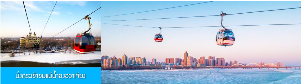
นั่งกระเช้าชมแม่น้ำซวงเวาเจียง

พักที่ VIENNA INTER HOTEL โรงแรมระดับ 4 ดาวท้องถิ่น ในเมืองเมืองซ่งจี้