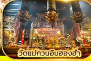
วัดแม่กวนอิมของฮ่า