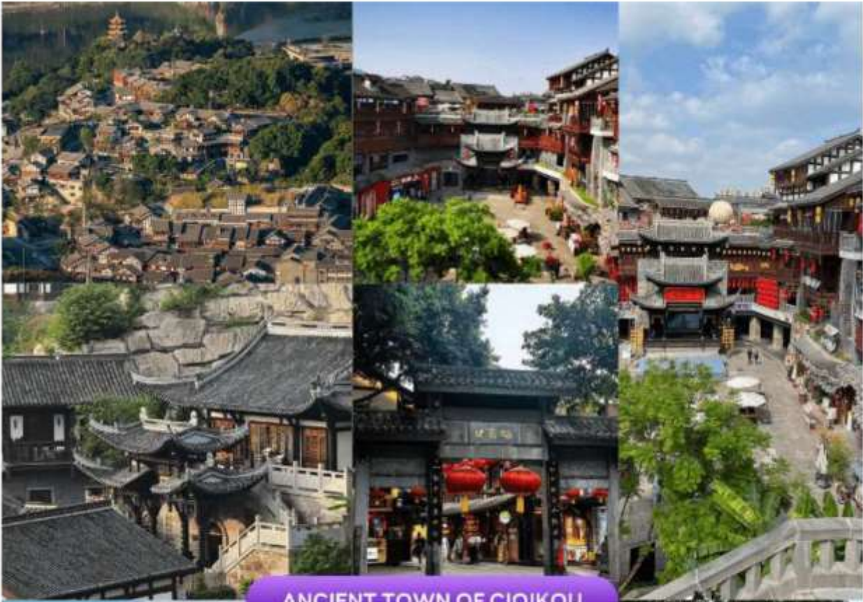
ANCIENT TOWN OF CIQIKOU