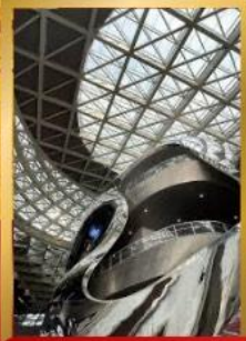
พิพิธภัณฑ์ศิลปะร่วมสมัยเซินเจิ้น

ชมสถาปัตยกรรมระดับโลก พิพิธภัณฑ์ศิลปะร่วมสมัยเซินเจิ้น (MOCAPE) และ Shenzhen Civic Center