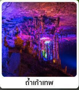
ดำเก้าทพ