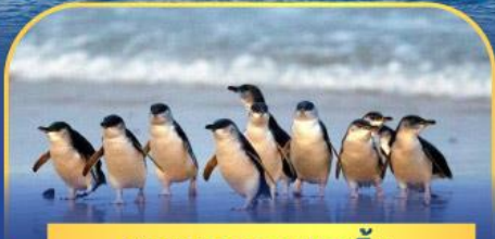
พาเหรดนกเพนกวิน