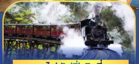
รถไฟพัพฟิงบิลลี่

ล่องเรือชมอ่าวซิดนีย์พร้อมรับประทานอาหารกลางวัน และ เข้าชมสวนสัตว์การองก้า