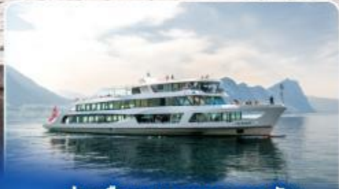
ล่องเรือทานอาหารกลางวัน ทะเลสาบลูเซิร์น