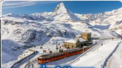
นั่งรถไฟสู่ยอดเขา กรอนเนอร์เกรต