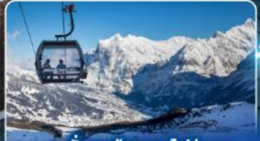
นั่งกระเช้าและรถไฟสู่ ยอดเขาจุงเฟรา