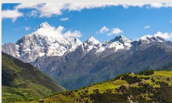
ภูเขาสี่ดรุณี (หุบเขาชวงเจียวโกว)