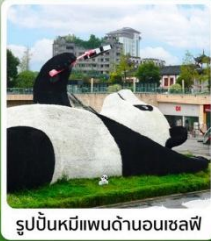
รูปปั้นหมีแพนด้าบนถนนเซฟิ