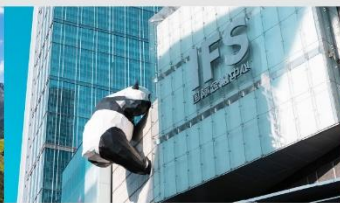
แพนด้ายักษ์ปีนตึก IFS