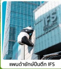
แพนด้ายักษ์ป็นตึก IFS