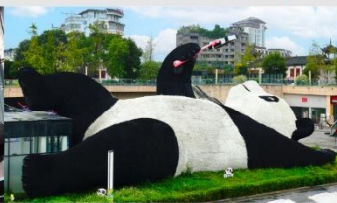
รูปปั้นหมีแพนด้าอนเซลฟี่