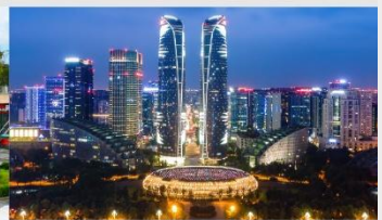
ตึกแฝดเจิงตุ

*ทางบริษัทฯ ขอสงวนสิทธิ์ในการสลับโปรแกรมทัวร์ตามความเหมาะสมขึ้นอยู่กับสถานการณ์หน้างาน โดยคำนึงถึงผลประโยชน์ของลูกค้าเป็นสำคัญ