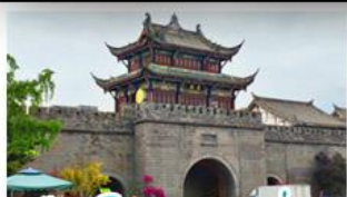
เมืองโบราณกวนเซี่ยน

ภูเขาสดุดี - อุทยานป่ฝิงโกว - สะพานหนานเฉียว - ร้านหนังสือจงซูเก้อ - เมืองโบราณกวนเสียน จตุรัสอย่างเทียนหวู่ - หิมะแพนด้าเซลฟี - ถนนโบราณชอยกวังชอยแคบ - ถนนคนเดินไท่กู่หลี่ ถนนคนเดินซุนซี - ถนนโบราณจิ่นหลี่ - แพนด้ายักษ์ปิงตึก - น้ำพุไม้ไผ่ตึกSKP - วัดต้าเจี๋ย