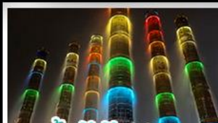
น้ำพุไม้ไผ่ตึกSKP