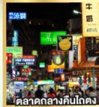
ตลาดกลางคืนโกตง