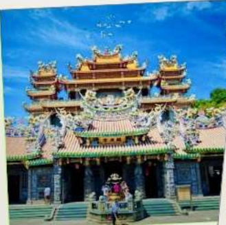
วัดกวนตู่