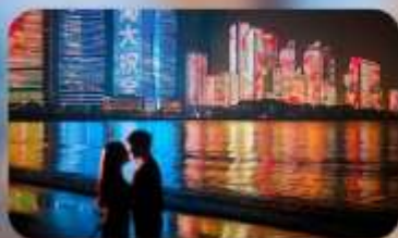
ชายหาดหมายเลข 3