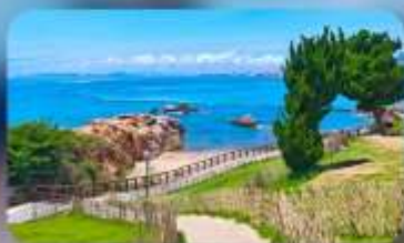
เกาะสี่เหลี่ยมเต่า