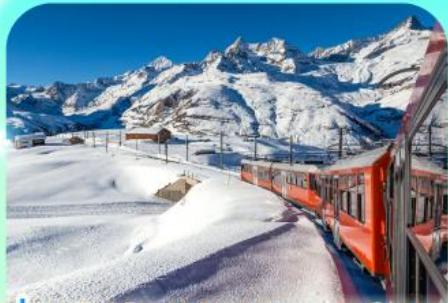
นั่งรถไฟสู่ยอดเขารอนเนอร์เกรต