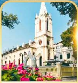
เกาซาเมียน