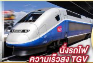
นั่งรถไฟ ความเร็วสูง TGV