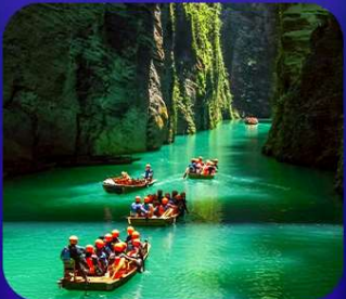
“ ผิงซานแกรนด์แคนยอน ”

เที่ยวจีน 2 มณฑล เสฉวน+หูเป่ย์ • ถ้าถึงหลง • หุบเขาสิงโต ซื่อจื่อกวน ล่องเรือมังกรกังส่วยชมวิวยามค่ำคืน • ผิงซานแกรนด์แคนยอน (รวมล่องเรือ) หงหยาดัง • จุดชมรถไฟฟ้าทะลุทิว • ตึกตะเทียบ • สือปาตี • หลงเหมินฮ่าว