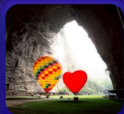
“ ถ้าถึงหลง ”