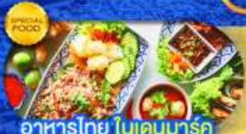
อาหารไทย ในเดนมาร์ก