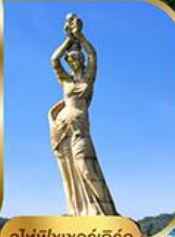
จูไห่ฟิชเชอร์เก็ส