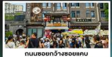
ถนนชอยกว้างชอยแคบ