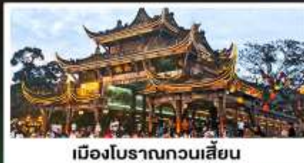
เมืองโบราณทวนเสียน