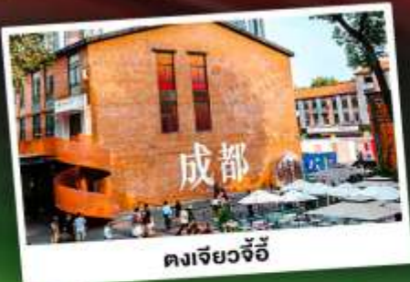
ตงเจียวจี้

เทือกเขาแอลป์แห่งเมืองจีน ชมความงามของ "อุทยานภูเขาสี่ครุฑ"