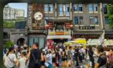
ถนนชอยกวางชอยแคบ