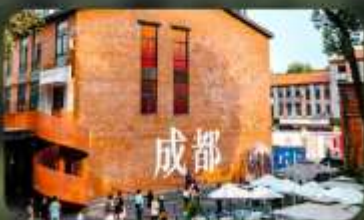
ดงเจียวจี้

HOLIDAY INN EXPRESS HOTEL หรือเทียบเท่า 4 คาว