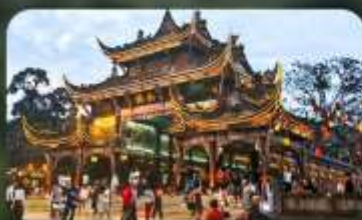
เมืองโบราณกวนเสี้ยน