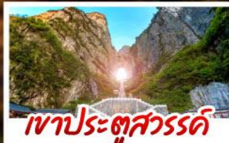
เขาประตูลสวรรค์