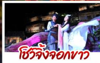
ชีวิตจริงจอกขาว