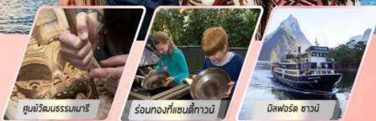
ศูนย์วัฒนธรรมเมารี

เที่ยวเกาะใต้ และเกาะเหนือ : 12 วัน 10 คืน