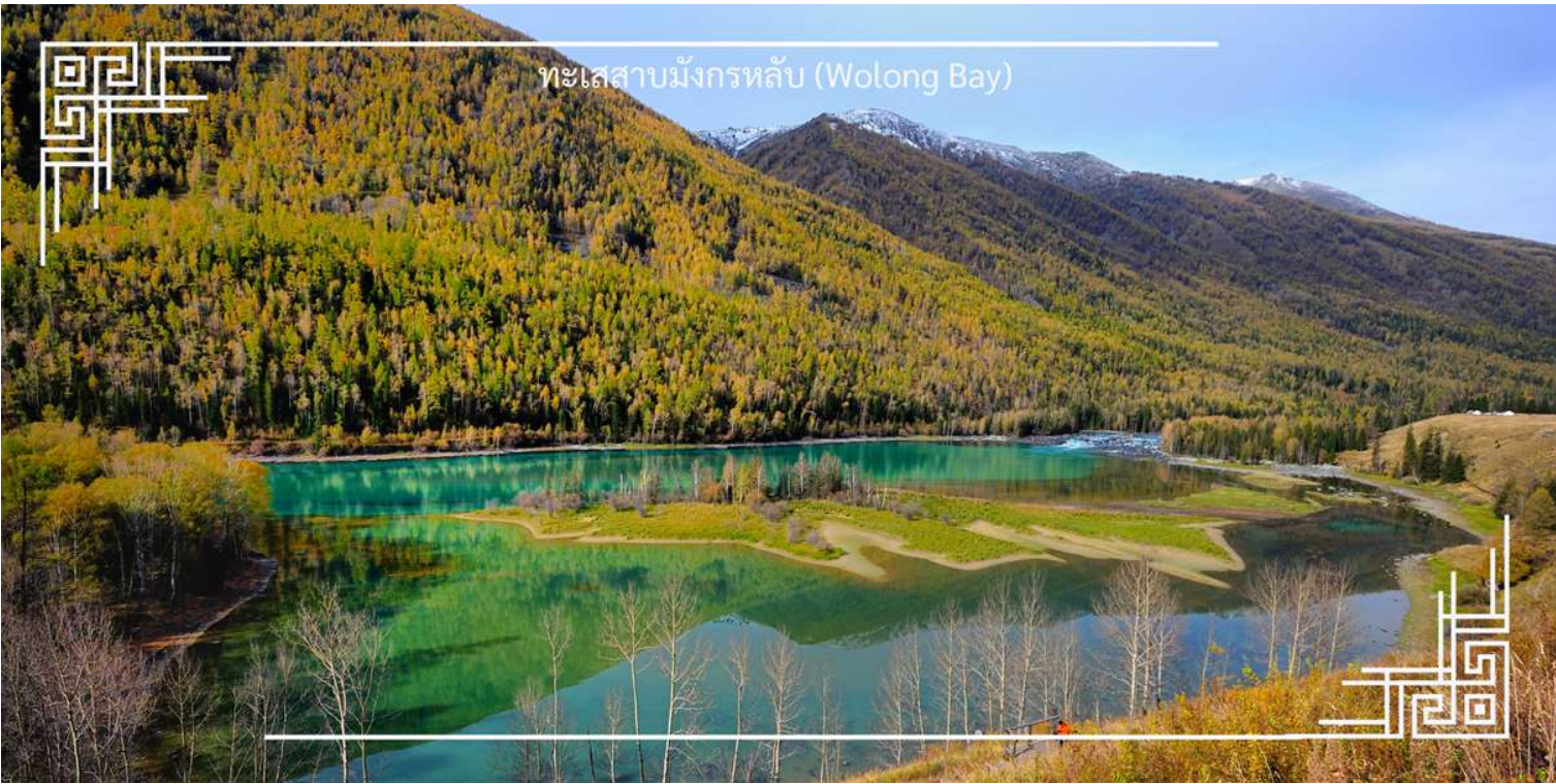
ทะเลสาบมังกรหลับ (Wolong Bay)

จากนั้นนำท่านชม ทะเลสาบเทวดา (Fairy Bay) จุดชมวิวไฮไลท์ที่ตั้งอยู่ทางตอนใต้ของทะเลสาบคานาสีอู่ ภายในเขตโดดเด่นด้วยผืนน้ำใสสะท้อนเงาขุนเขาและผืนป่า สร้างบรรยากาศราวดินแดนในเทพนิยาย สถานที่แห่งนี้มีชื่อเรียกตามตำนานท้องถิ่นว่า “อ่าวของเหล่าเซียน” โดยเล่าขานกันว่าเป็นสถานที่ที่เหล่าเทพเซียนลงมาเล่นน้ำ จึงยังเพิ่มเสน่ห์และความลึกลับให้กับทัศนียภาพอันงดงาม