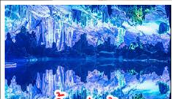
ถ้ำลู่ย้อ