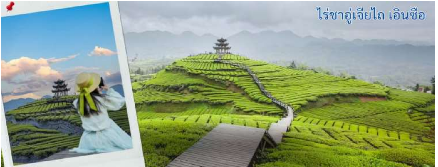
ไร่ชาอู่เจียไถ เอ็นซี

หลังจากรับประทานอาหารกลางวัน นำทุกท่านเดินชม ภูเขาใบชาอู่เจียไถ คือแหล่งมรดกโลกที่ตั้งอยู่ในเขตภูเขา มณฑลชานซี ประเทศสาธารณรัฐประชาชนจีน เป็นหนึ่งในสี่ภูเขาอันศักดิ์สิทธิ์ทางพุทธศาสนาของจีน ณ ภูเขาอู่ไถแห่งนี้เป็นที่ประทับของพระมัญชุศรีโพธิสัตว์ ธรรมราชาภุมารในคติของพระพุทธศาสนามหายาน ได้รับการจัดระดับโดยคณะกรรมการจัดระดับคุณภาพสถานที่ท่องเที่ยวแห่งประเทศไทยระดับ 5A เมื่อปี 2550 ภูเขาใบชาอู่เจียไถ ตั้งอยู่ในเขตชานฮั่น มณฑลหูเป่ย์ ประเทศจีน เป็นแหล่งผลิตชาคุณภาพสูงที่มีชื่อเสียง โดยเฉพาะชา กังฉา ซึ่งเคยเป็นชาชั้นสูงที่ถวายแด่ฮ่องเต้ในอดีต แม้ว่าข้อมูลในวิกิพีเดียภาษาไทยจะเน้นไปที่เขาผู่ถั่ว (ที่ประทับพระแม่กวนอิม) หรือเขาอู่ไถ (หนึ่งในสี่ภูเขาศักดิ์สิทธิ์) แต่ อู่เจียไถ เป็นที่รู้จักในฐานะไร่ชาที่มีทิวทัศน์สวยงามและผลิตชาชั้นดี มีการจำหน่ายและให้ชิมชาชา ชาเขียว และชาท้องถิ่น