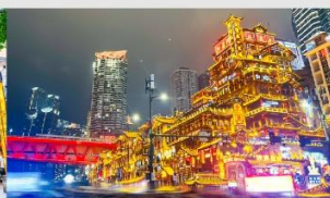
หงหยาดัง(ชมไฟยามค่ำคืน)

*ทางบริษัทฯ ขอสงวนสิทธิ์ในการสลับโปรแกรมทัวร์ตามความเหมาะสมขึ้นอยู่กับสถานการณ์หน้างาน โดยคำนึงถึงผลประโยชน์ของลูกค้าเป็นสำคัญ