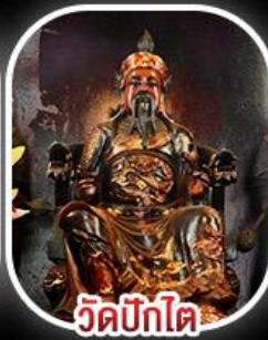
วัดบิกิต