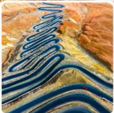
ถนนผานหลงกู่ต้าว