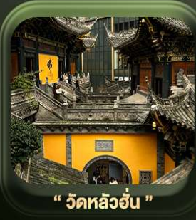
“ วัดหลิวอัน ”