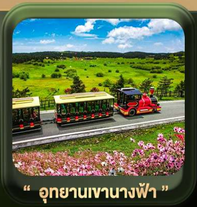
“ อุทยานเขานางฟ้า ”