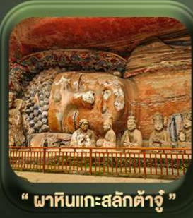
“ พาทินแกะสลักต้าจู้ ”

T2G-CKG26CZ Special of Chongqing...วงซิ่ง ต้าจู้ อุ้หลง อุทยานหลุมฟ้า เขานางฟ้า 5D 3N (CZ)