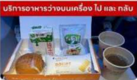
บริการอาหารว่างบนเครื่องบิน ไป และ กลับ