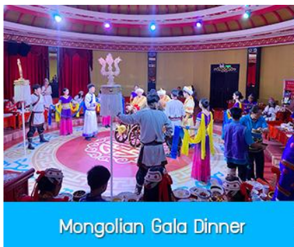
Mongolian Gala Dinner

那达慕 Naadam Festival หรือเทศกาลเฉลิมฉลองที่คล้ายวันตรุษจีนของชาวจีน ประกอบด้วยกิจกรรมการเล่นพื้นเมืองแบบมองโกล รวม 22 อย่าง ได้แก่ พิธีแต่งงานเออร์คอส / การขี่ม้าในสนาม / ปาร์ตี้รอบกองไฟ / ขี่ม้าถ่ายรูป / สไลเดอร์หญ้า / รถลางทุ่งหญ้า / สวนแขวงกต / สวนเด็กเล่น / ตีกอล์ฟทุ่งหญ้า / รถบังคับ / รถโกคาร์ต / โยนบอลทุ่งหญ้า / ปั่นไฟมองโกล / ยิงธนูในร่ม / แข่งขันจับแกะ / คล้องม้าจำลอง / หมูเลี้ยงน้ำเอ็นดู / เครื่องเล่นหมุน / เลี้ยงแกะโยน / ยิงธนู / ทอยแจกัน / เซ็นต์ชื่อภาษา มองโกล ให้เลือกเล่นได้ 12 อย่างตามรายการที่ระบุ.....อัตราค่าบริการสำหรับ 那达慕 Naadam Festival 380 หยวน หรือ 1,900 บาท/ท่าน (สำหรับลูกค้าทัวร์ที่ไม่ซื้อโปรแกรมเสริม สามารถเดินเล่น ถ่ายรูปบริเวณทุ่งหญ้าหรือพักผ่อนตามอัธยาศัย)