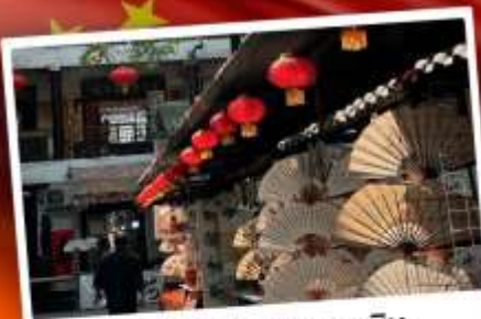
ถนนโบราณซูหยวนเหมิน

"มรดกโลกพันปี สุสานทหารดินเผา" แต่งชุดจีนโบราณ เดินถนนวัฒนธรรมต้าถิง