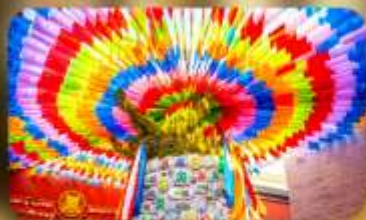
วัดลามะกว้างเหริน