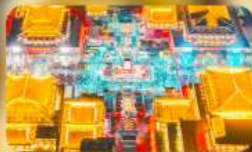
ถนนวัฒนธรรมต้าถิง