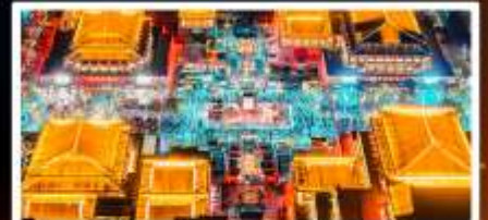
ถนนวัฒนธรรมต้าถิง