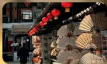
ถนนโบราณซูหยวนเหมิน