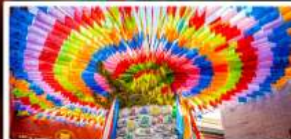
วัดลามะกว้างเหริน