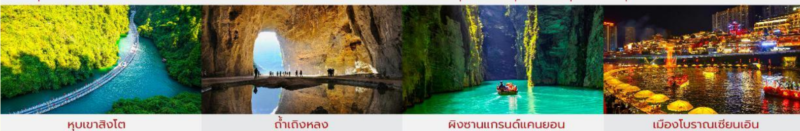
หุบเขาสิงโต