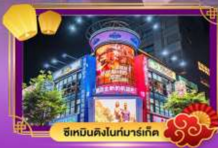
ซีเหมินดิงไนท์มาร์เก็ต