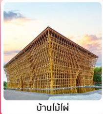
บ้านไม้ไผ่

ไอโวลท์ เทียวครบ สวนน้ำ Aquatopia & สวนสนุก Vin Wonder เวนิสแห่งเวียดนาม Grand World Phu Quoc แลนด์มาร์คสุดโรแมนติก