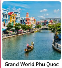
Grand World Phu Quoc