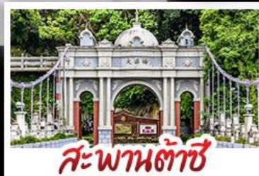
สะพานต้าซี