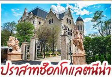
ปราสาทช็อกโกแลตนี้น่า