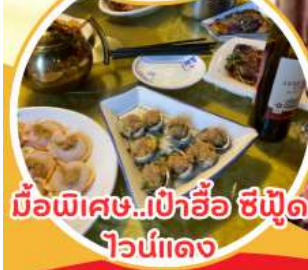
มือพิเศษ...เป่าอ้อ ซีฟูด ไวน์แดง