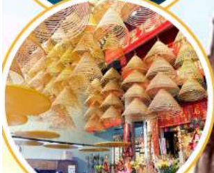
ไหว้พระวัดดัง