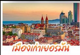
เมืองเก่าเยอรมัน

เมืองเก่าชิงเต่า - สลับกับเมืองโบราณหมิงสุ่ย เมืองเก่าเยอรมัน - ไรไวน์ฟางยู - สวนสตรอว์เบอร์รี่