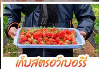
เก็บสตรอว์เบอร์รี่