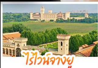
ไรไวน์ฟางยู