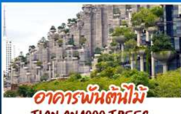
อาคารพันต้นไม้อู๋เทียน TIAN AN 1000 TREES