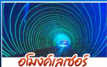
อู๋มิงค์เลเซอร์