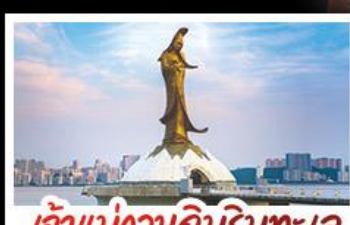
เจ้าแม่กวนอิมริมทะเล