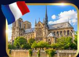
มหาวิหารนอร์ม็องดี