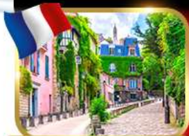
Rue de l'Abreuvoir มงมาร์ต