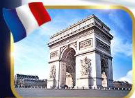
ประตูชัยอาร์กเดอทรียงฟ์