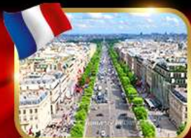
เดินเล่นย่านช็องเซลีซ