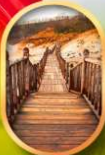
หุบเขาจิกุกาดานิ