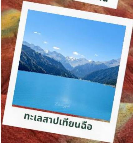
ทะเลสาปเทียนฉือ