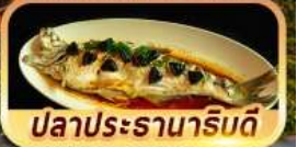
ปลาประรานาριθดี