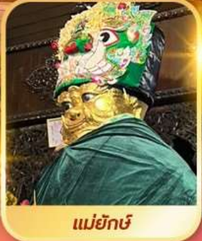
แม่ยักษ์