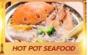
HOT POT SEAFOOD