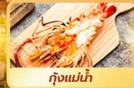
กุ้งแม่น้ำ