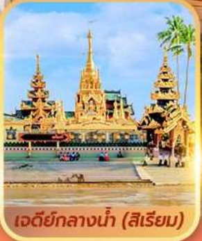
เจดีย์กลางน้ำ (สิริเยม)