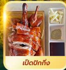
เบ็ดปักกิ้ง