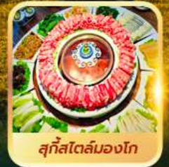
สุกีสโตลมองโก