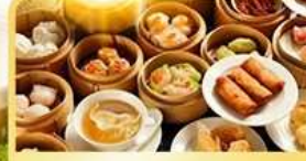
อาหารกวางตุ้ง