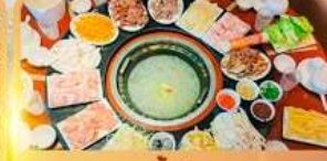
สุกี้เห็ด