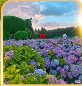
ดอกไม้ตามฤดูกาล